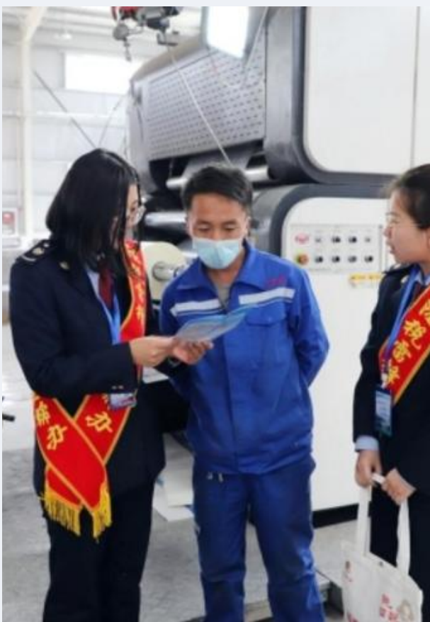
图：民乐县税务干部深入企业生产车间，面对面辅导研发加计扣除政策

“匡正干的导向，增强干的动力，形成干的合力。”将主题教育学习成果转化应用于促发展中，甘肃省税务系统将不折不扣地落实好研发费用加计扣除政策，通过优惠政策点滴灌溉，催化企业不断技术革新，在促进企业科技成果转化、推进科技自立自强中发挥更大作用贡献税务力量。