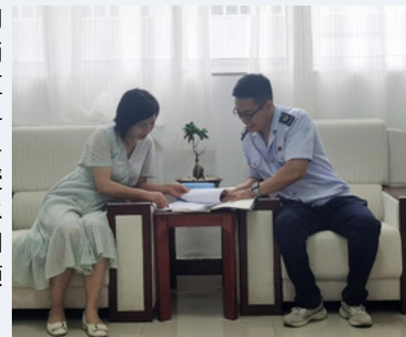
图：嘉峪关市税务干部送政策入企

嘉峪关索通预焙阳极有限公司作为从事预焙阳极研发、生产和销售龙头企业，自成立以来，一直以科技为力量，创建了2个省级科研平台，取得6项省部级及行业科技进步奖、8项科技成果、33项授权专利，研发出了达到国际领先水平的高品质、低能耗的绿色预焙阳极生产整体工艺技术，实现了引领行业发展的目标。