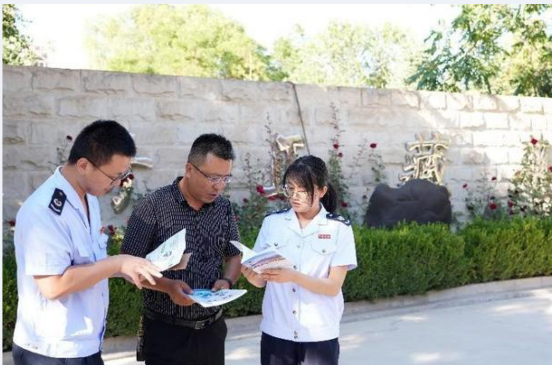
图为榆中县税务干部走进甘肃奇正藏药有限公司了解企业享受各项税费优惠政策情况

藏药是中医药宝库中的重要组成部分。位于兰州市榆中县的甘肃奇正藏药有限公司是藏药龙头企业西藏奇正藏药有限公司的全资子公司，拥有22项国家专利技术，生产的奇正消痛贴膏在外用止痛药物市场连续六年销售排名第一，年销售额突破亿元。消痛贴膏的销售奇迹就是公司坚持不懈注入科技动能，深挖临床价值，不断激发‘拳头产品’活力的结果。榆中县税务局落实落细企业投入基础研究、促进科技成果转化等方面的税收优惠政策，鼓励产生更多创新成果，助推创新成果更好转化。通过实施固定资产加速折旧等政策，支持企业设备的升级换代；对企业科技人员取得的股权奖励以及高校院所研究人员取得职务科技成果转化的奖励落实个人所得税优惠，提高企业科研骨干的积极性和创造性。