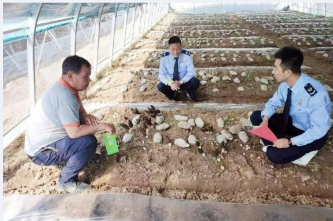
图为康县税务局“税顾问”深入田间地头了解中药材种植情况

陇南，是甘肃这柄美丽“玉如意”最美的一角。日照充裕、气候温润，南北过渡、阴阳调和的原生态造就了陇南得天独厚的中药材生长土壤和休闲放松的康养环境。近年来，陇南大力推动中医药康养与文化休闲旅游融合发展，将官鹅沟-哈达铺旅游区、云屏旅游区打造成为中医药养生保健旅游标志性景区，依托当地物产，创新开发的“药食同源”保健食品备受消费者青睐。