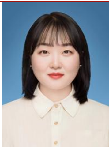
作者： 已取得法律资格执业证书 中级会计师 甘肃政府采购评审专家

解决上述问题，其中最重要的步骤就是“两评一案”的论证，指引涵盖了法律法规需要强调的关键论证内容，保障“两评一案”的真实性和合规性，论证内容及数据有理可依，有据可循，强化入库项目前期论证；指引中合理规划风险承担主体，明确责任的归属，可以适当规避建设运营环节的推责揽责行径；指引中还涵盖了项目是否必须实施的必要性，既要考虑货币因素也要考虑非货币因素，既要考虑经济效益也要考虑社会效益（环境保护、产业发展、就业创造等），避免造成部分项目形成损失浪费的结果。